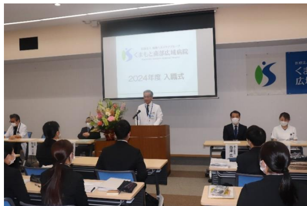
町田院長 歓迎の言葉