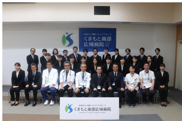
新入職員23名及び幹部職員