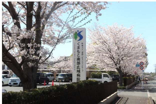
入職式当日 満開の桜