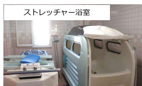
ストレッチャー浴室

自立の方から入浴が難しい方まで、ひと時の心地よさを感じていただける光の射し込む広めの浴室です。