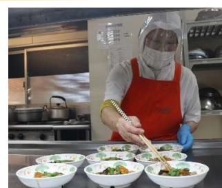
イベント時のお花見弁当